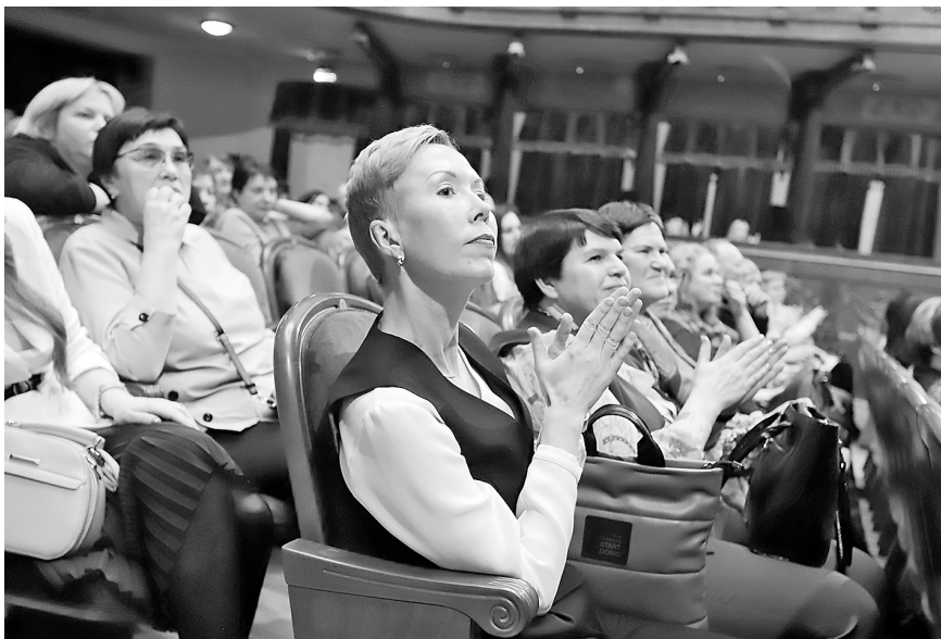
Зрители проголосовали за финал.

Премьера спектакля «Айвазовский. Три стихии» состоялась в Волковском театре в субботу. Мультимедийный байопик, как определен жанр спектакля, – это часть культурного проекта, в который включены выставка картин Ивана Айвазовского в Художественном музее и ролик «Труженики моря» ярославского аниматора, обладателя премии «Оскар» Александра Петрова.