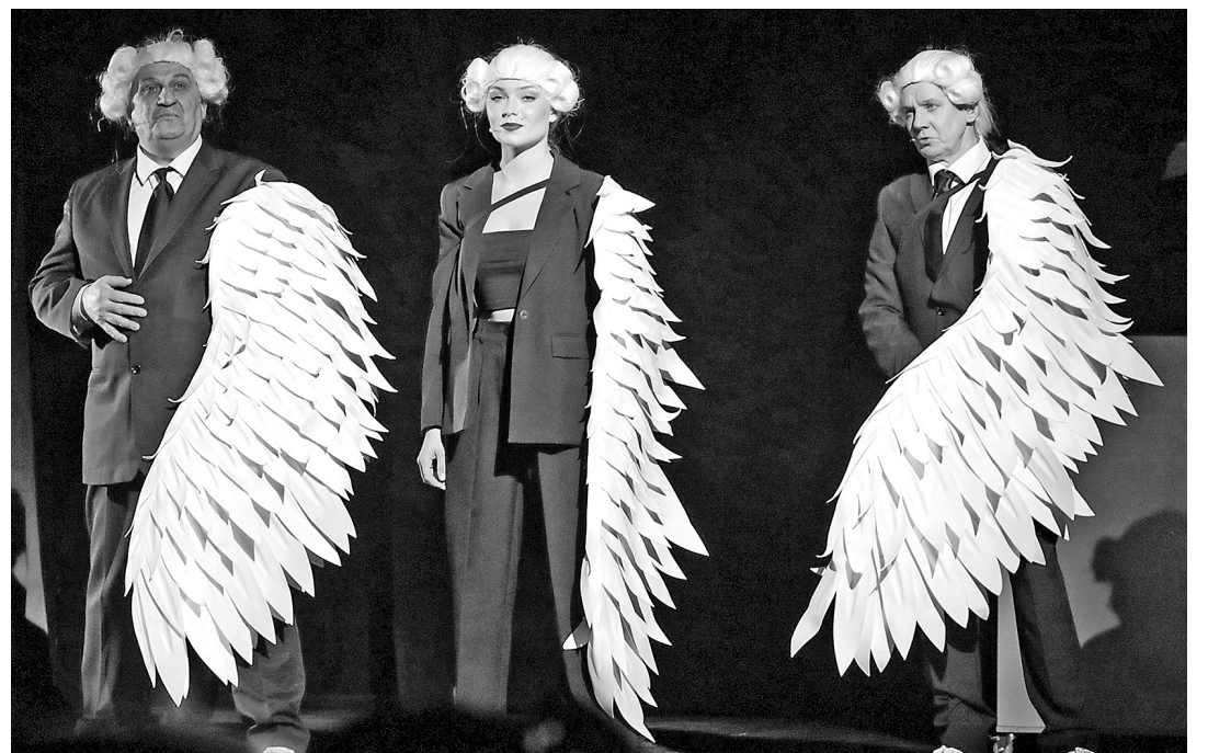
Суд в небесной канцелярии.