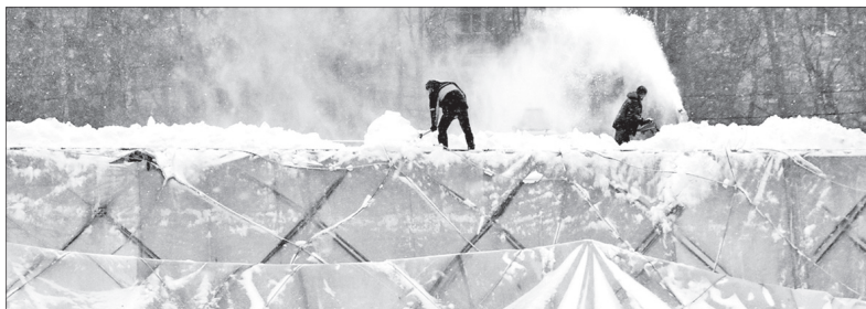
Купол не выдержал напора стихии.

Вчера, во вторник, из-за сильного снегопада не выдержал купол легкоатлетического манежа «Ярославль» на улице Чкалова. В тканевом покрытии купола образовалась 10-метровая прореха.