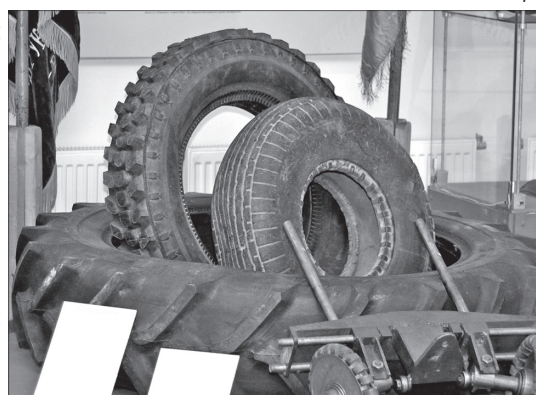
Продукция шинного завода.