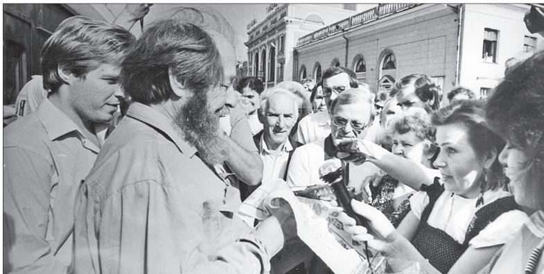
На фото визит А. Солженицына в Ярославль.

– так называется выставка в историко-архитектурном музее-заповеднике, посвященная 80-летию Ярославской области.