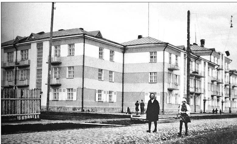
Так выглядел дом в первые годы своей жизни.

Среди множества известных творений архитектора выделя-