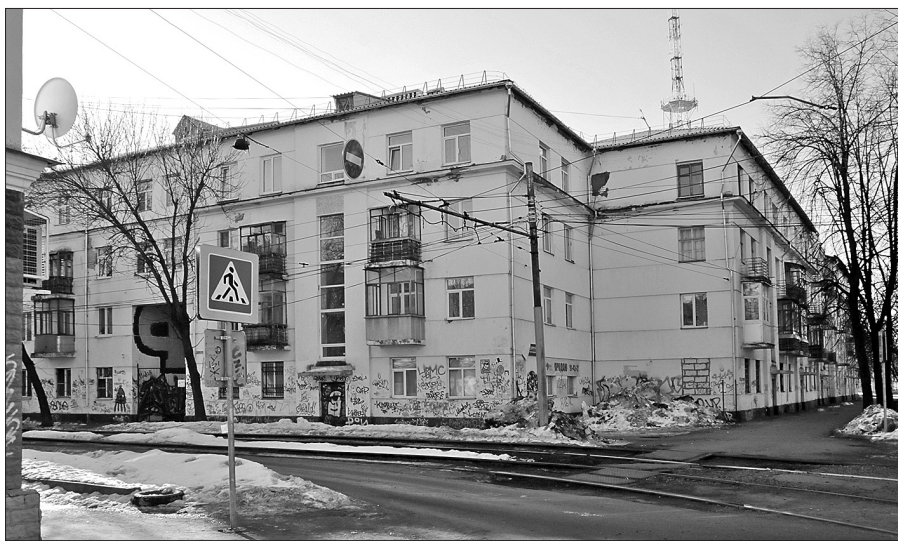
Современный вид дома.

Очень часто темы для публикаций подсказывают сами читатели газеты. В одном из писем нас попросили рассказать о «шведском доме» в Ярославле. Его история оказалась действительно интересной.