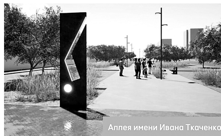
Аллея имени Ивана Ткаченко