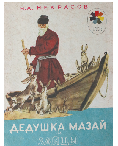
↓ Книга с иллюстрациями Дементия Шмаринова, пожалуй, самая издаваемая в России среди других «Мазаев».

Выпускник Всесоюзного института кинематографии Ильдар Урманче известен как художник-постановщик 11 мультфильмов. И по сей день дети с огромным удовольствием смотрят «Баранкин, будь человеком!» Этот великолепный мультфильм снят в 1963 году, а в 1965-м он был удостоен приза и