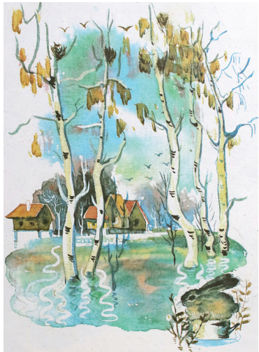
↓ Иллюстрация Галины Ли.