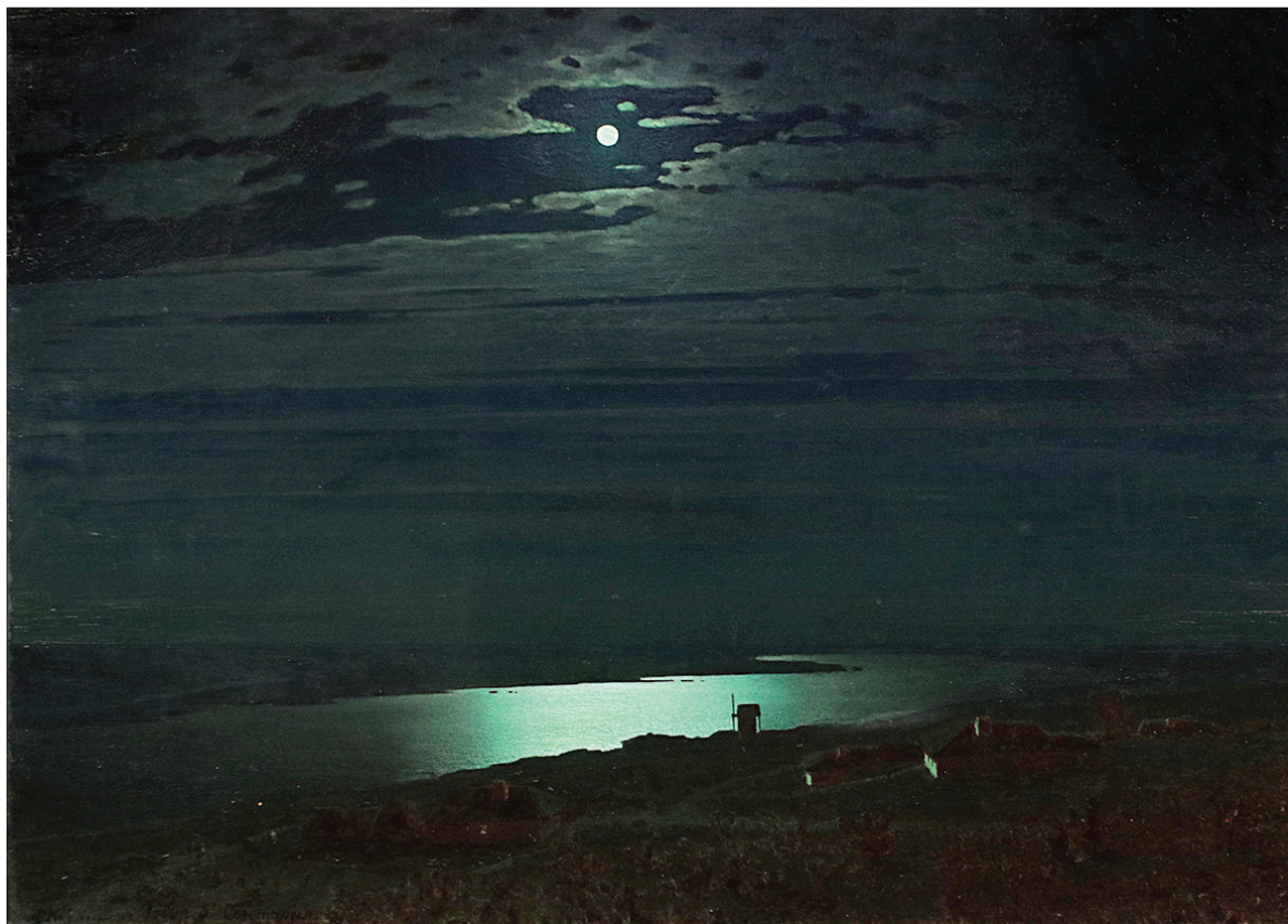
Лунная ночь на Днепре.

Жизнь Архипа Куинджи до сих пор окутана легендами. Будучи на вершине популярности и успеха, художник вдруг перестал выставляться. Его затворничество длилось почти три десятка лет. Он продолжал работать, поддерживал дружеские отношения, преподавал, но картин своих не показывал. Многочисленные полотна, над которыми Куинджи трудился в те годы, его ученики и друзья смогли увидеть только после его смерти. Сейчас у ярославцев появилась уникальная возможность увидеть эти произведения на открывшейся выставке. Это горные и морские пейзажи, зимние этюды, знаменитые пышные, светящиеся «куиндживские облака» и полыхающие красками закаты.