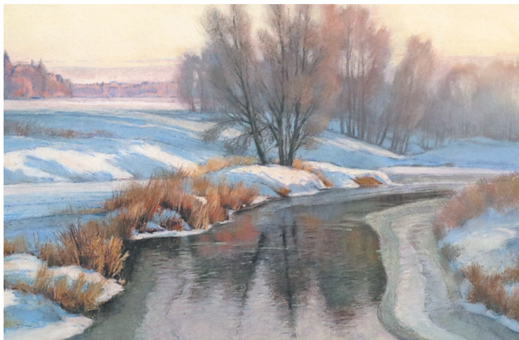
↓ «У зимней реки».