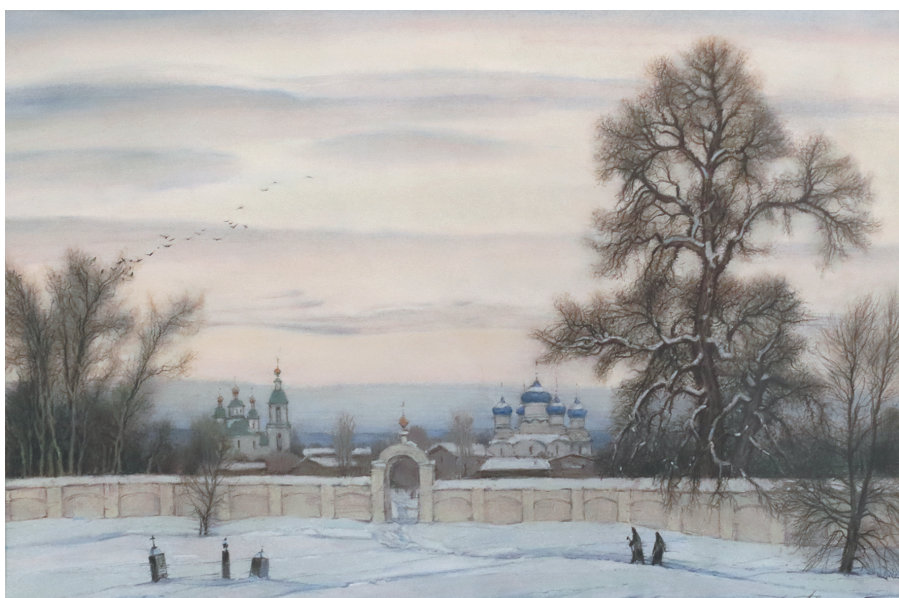
↓ Из серии «Думы о...».