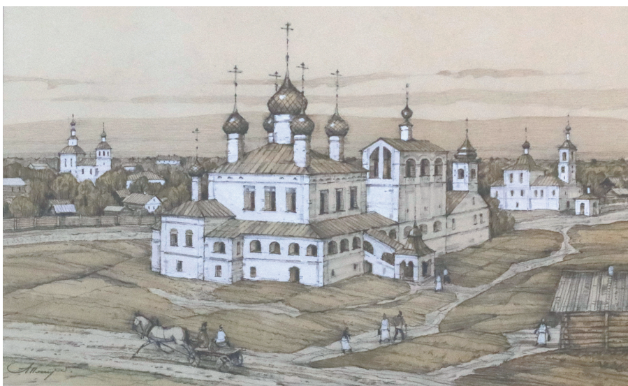
↓ «Воскресенский монастырь». Из серии «Углич в XIX столетии».