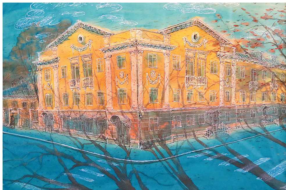
↓ «Ярославские дома. Дедушкин дом».