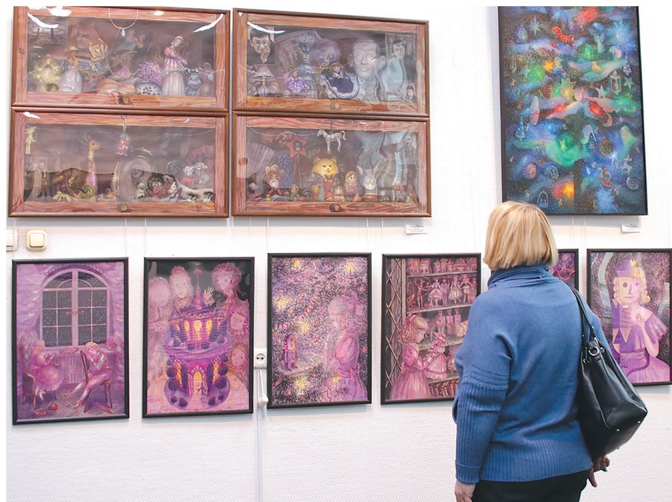
↓ На выставке.

– Изобразительное искусство многогранно, – говорит художник. – Для постижения глубинных смыслов одних произведений нужна словесная расшифровка всех изображенных элементов. Другие выстроены как логическая задача и требуют работы ума. Для понимания третьих неплохо бы знать биографию автора или исторический контекст. Нельзя с одними и теми же мерками подходить ко всем произведениям и пытаться впихнуть их в ограниченные рамки своего эстетического восприятия. Представленные на выставке работы не требуют ловкости ума и словесных