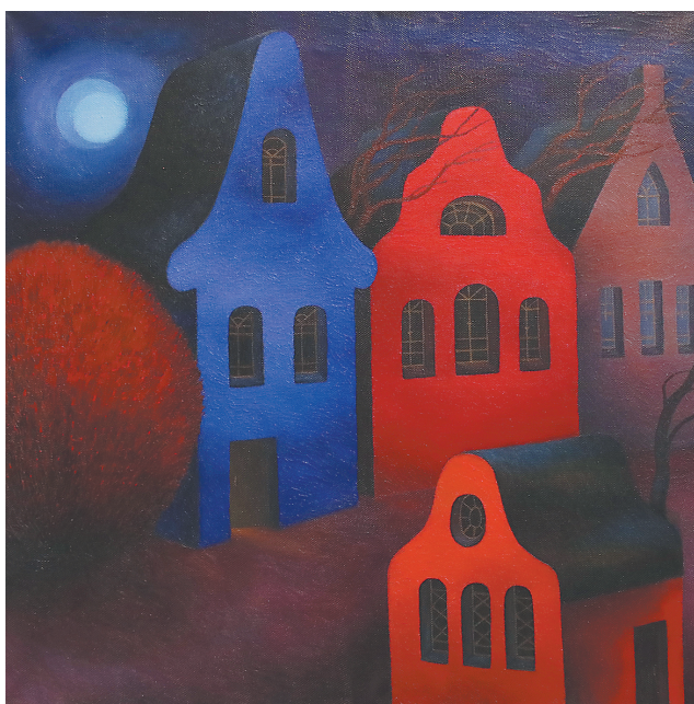
↓ «Ночной город из детских книг».

Произведения Аглаи несут в наш мир красоту, духов-