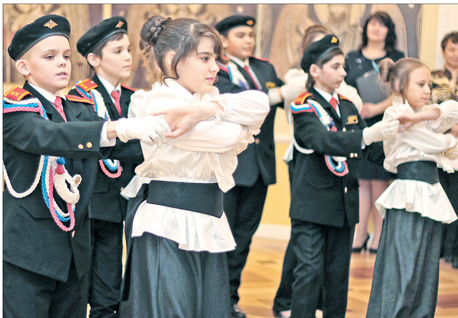
Вальс в исполнении учеников Великосельской школы.