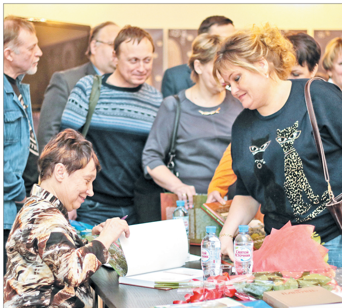
В очередь за автографом.