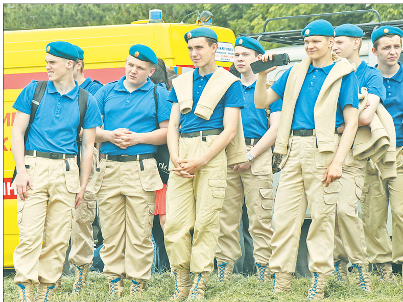
За учениями наблюдают юнармейцы.

В субботу, 1 июля, стартовал месячник безопасности на водных объектах. А накануне, в пятницу, на Центральном пляже прошла акция по обеспечению безопасности людей на водных объектах.