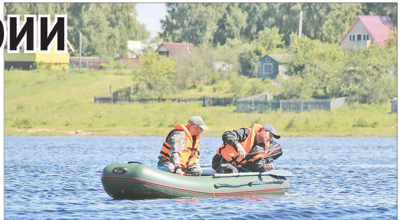
Рыбалка на Волге.

ровники. Там река делает крутой поворот, на большой скорости проносятся маломерные суда. Купающиеся в этом месте ярославцы сильно рискуют. На этом несанкционированном пляже будут установлены запрещающие аншлаги и проведена профилактическая работа с населением.