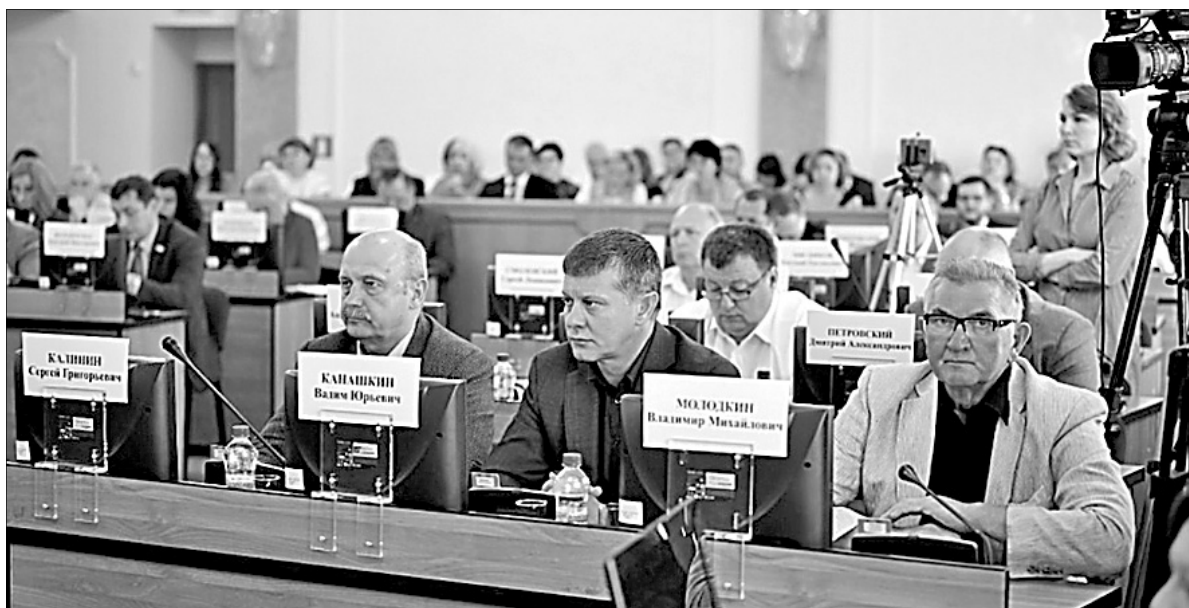
Идет заседание муниципалитета.