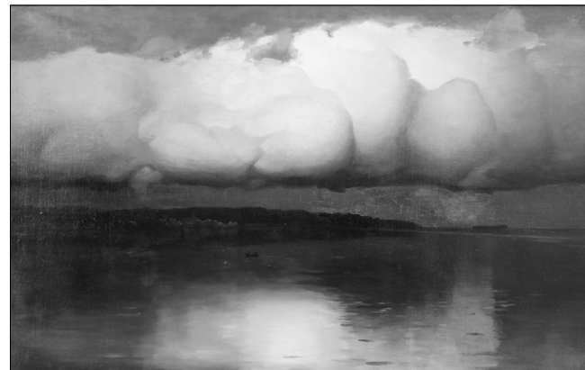
«Притихло. Надвигается туча».

На выставке представлены три петербургских пейзажа Николая Дубовского, картина «Первый снег» из собрания Угличского музея-заповедника. Другая грань творчества живописца — морской пейзаж. Его по праву можно назвать последним русским маринистом. Центральное место в экс-