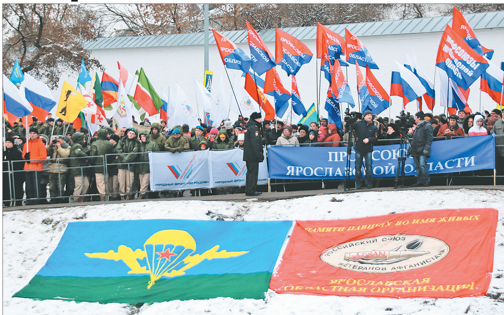
Ярославцы у часовни Казанской иконы Божией матери.