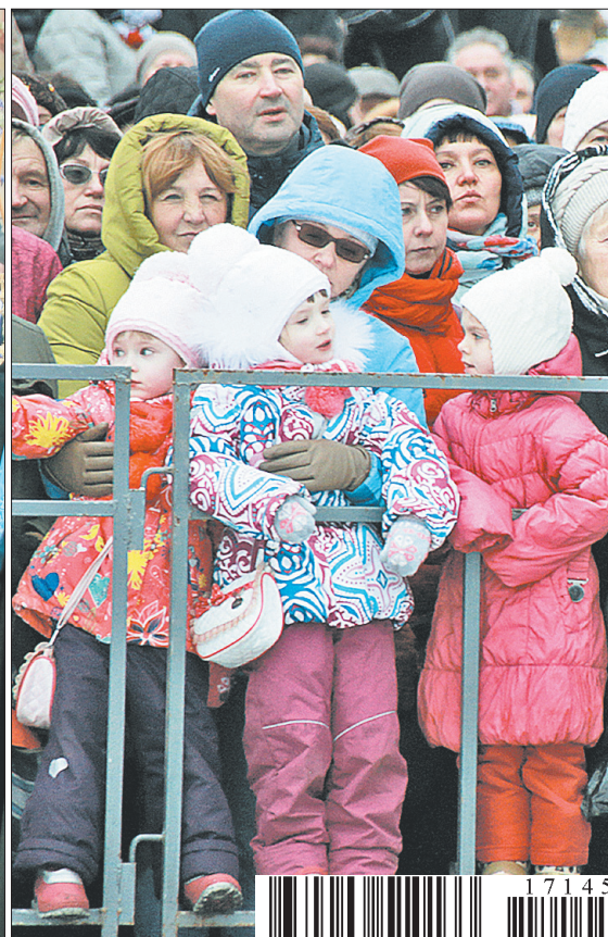
На праздник всей семьей.