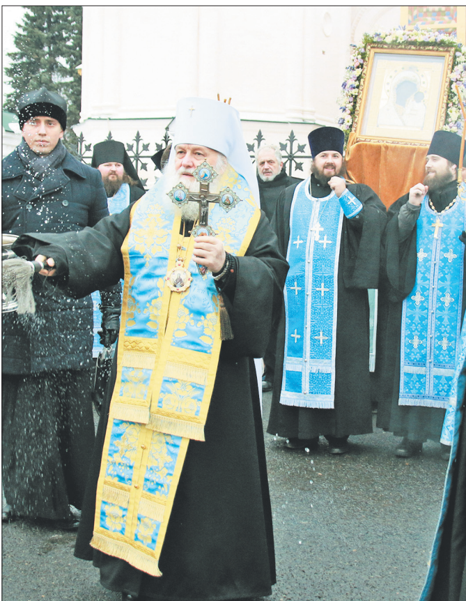
Митрополит Ярославский и Ростовский Пантелеимон.