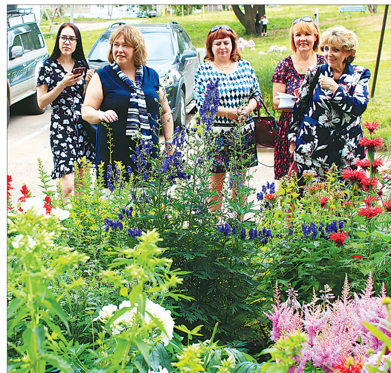
Цветник на ул. Ранней, 15.

В областном геронтологическом центре в этом году появились телега с цветами и фон-