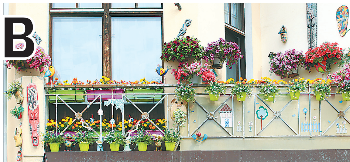
И на балконах ярославцы творят чудеса. Андропова, 27.

Во дворе дома № 7 по улице Суркова даже дорожка к контейнерной площадке и парковочные места утопают в цветах. Яркие мальвы на крыше маши-