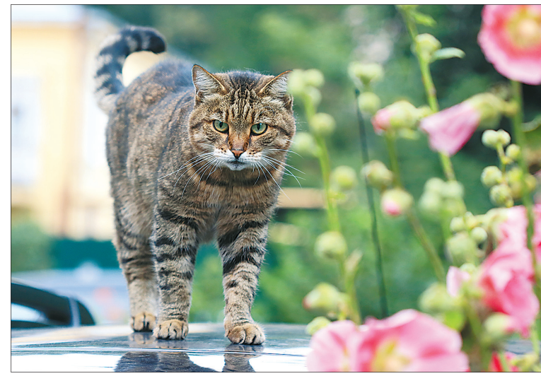
На страже цветов на ул. Суркова, 7.

Кировский район — это еще и частный сектор, в котором более семисот домов. Комиссию конкурса в Кармановском поселке ждали по трем адресам: на Полярной, 43, Сторожевой, 3 и Сельской, 44, где разбили цветники и перед домами, и позади них. Финальной точкой комисионного объезда стал детский дом музыкально-художественного воспитания. Там уже несколько лет расцветает аппетитный огород. Лекарственные растения выращивают воспитанники детского дома, изучая их полезные свойства.