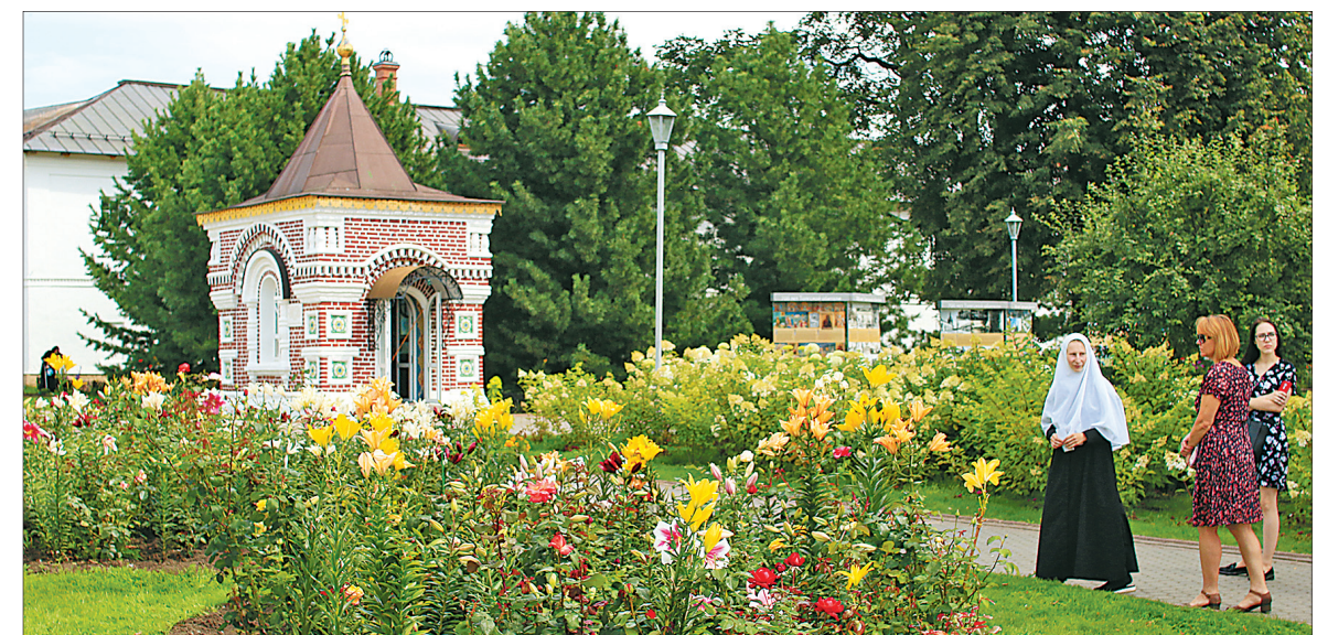
Толгский монастырь — уголок райского сада.