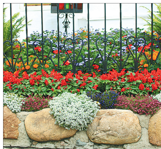
Церковь Спаса на Городу — царство цветов.