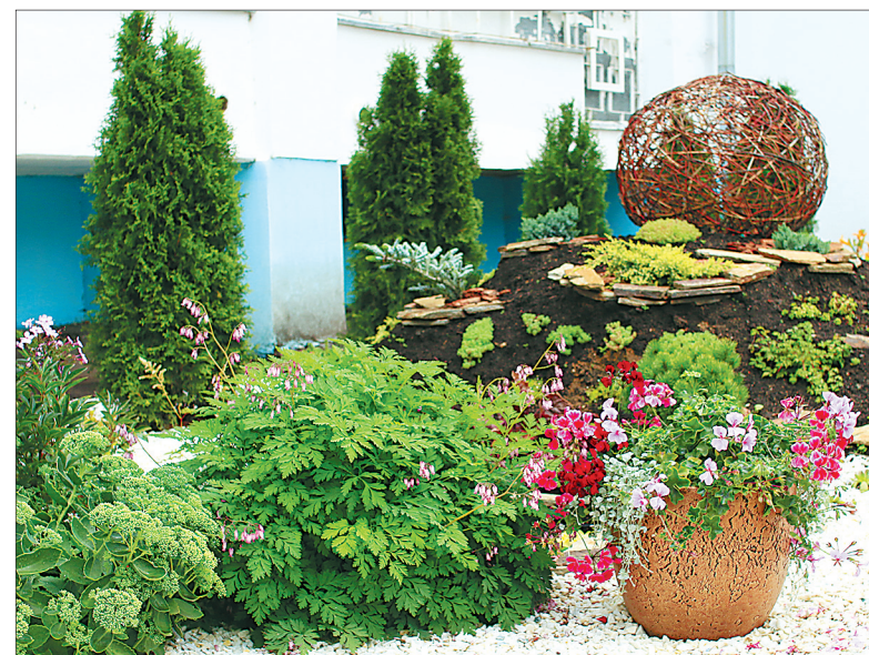
Ул. Революционная, 3.

тан. На заднем дворе разбит фруктовый сад, который уже дает первые, пусть и небольшие, урожаи. В уходе за цветами и садом по мере сил помогают пациенты центра.