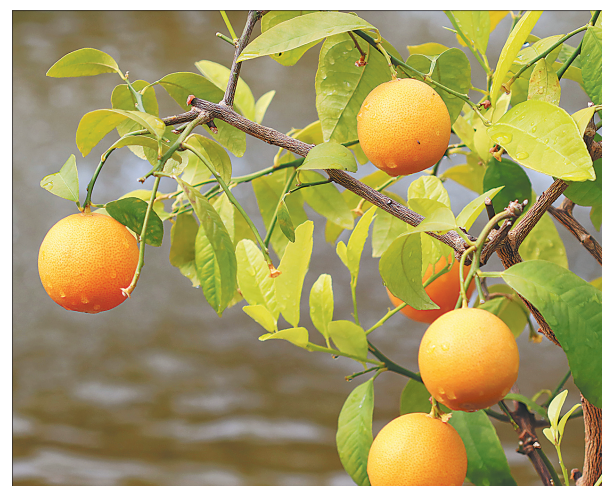
В ЯХМ — урожай мандаринов.

ны охраняет суровый котище. Чужих не пропускает, но к членам комиссии был благосклонен.