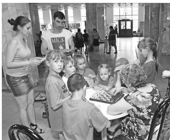
Шахматам все возрасты покорны.

Очередной фестиваль самой мудрой игры в мире побил рекорды сразу в двух «номинациях».