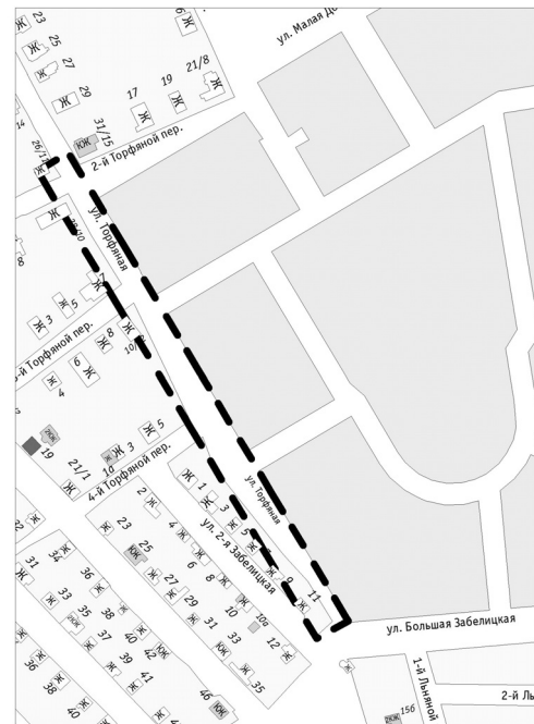
Схема границ территории линейного объекта – автомобильной дороги ул. Торфяная (на участке от 2-го Торфяного переулка до ул. Большая Забелицкая) в Красноперекопском районе города Ярославля

--- граница территории для подготовки документации по планировке территории.