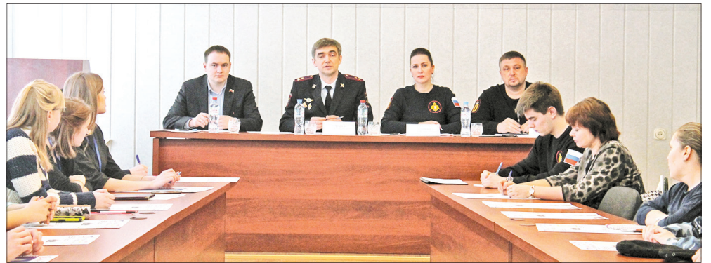
На совместном заседании Детского совета и ГИБДД.

При уполномоченном по правам ребенка работают три коллегиальных института – Экспертный, Общественный и Детский советы.