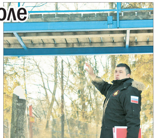
Проверяя безопасность моста.

В февральские дни пострадал еще один четырехлетний ребенок — скатившись с горки, он упал в реку в спортивном парке «Николина гора», получил переохлаждение и психологическую травму. Уполномоченный выехал на место ЧП совместно с представителями департамента по физической культуре, спорту и молодежной политике.