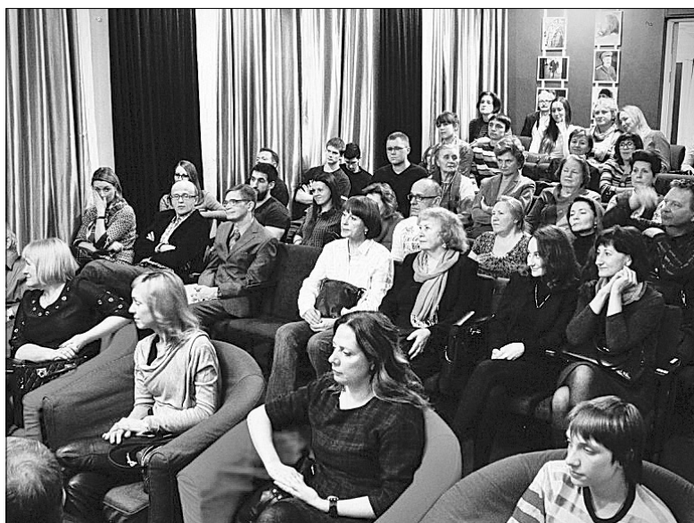
Фестиваль «Просто хорошее кино», 2015 г.