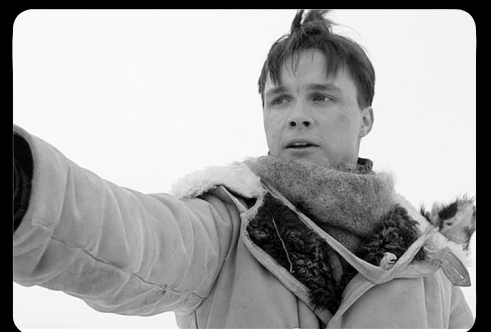
«Трагедия в бухте «Роджерс».