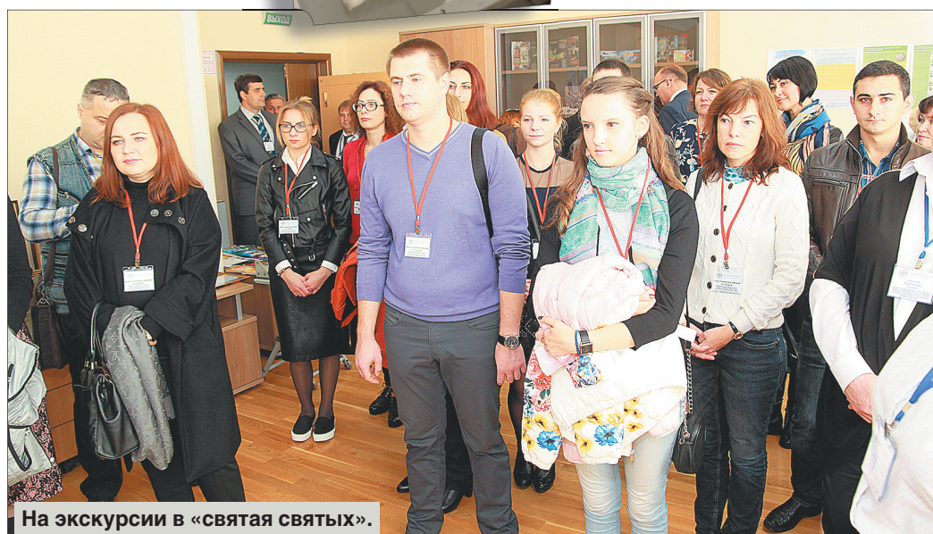
На экскурсии в «святая святых».

сразу за двух «кандидатов». Начавшие недавними выборами, посетители тут же заметили, что листов для голосования больше, чем участников.