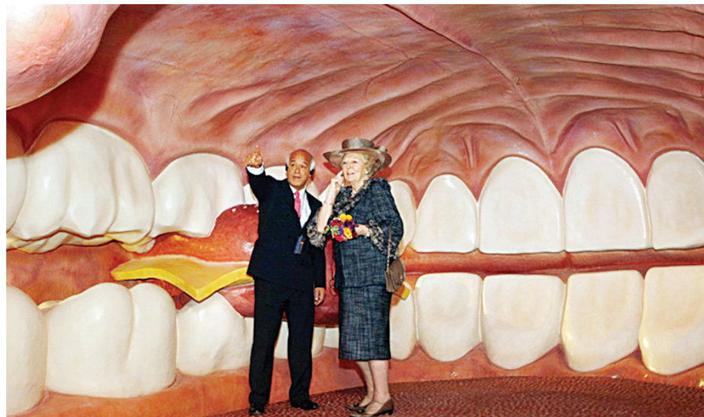
Совершить экскурсию по телу человека – это забавно.