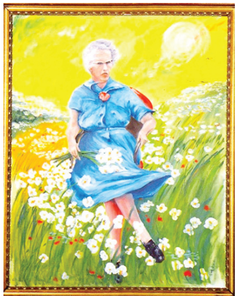
Экспонаты Музея плохого искусства имеют особую ценность.