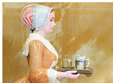
Здесь все из марципанов.