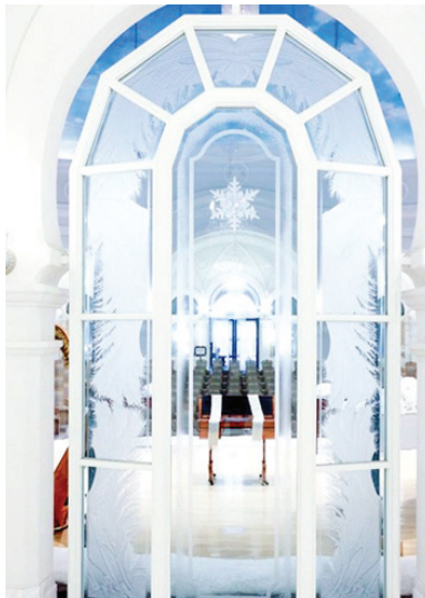
Музей снежинок в ледяных пещерах.

Музей расположен в ледяных пещерах. На стенах более 200 фото снежинок. Рядом – информация об их составе и строении. Для удобства ознакомления с фотоснимками в музее предусмотрена специальная винтовая лестница, а легкая прохлада усиливает ощущение того, что вы попали в царство Снежной королевы. Не правда ли, очень похоже на детскую сказку?