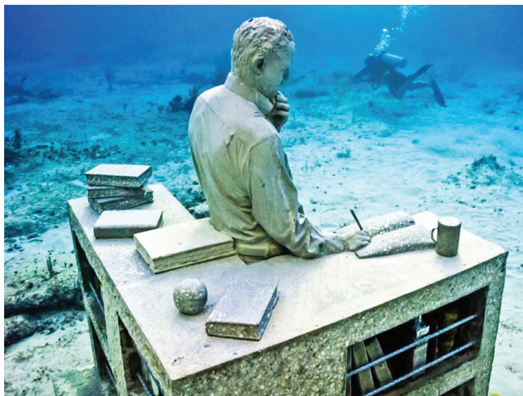
Подводный музей на дне Карибского моря.

Попадая в музей, даже самые плохие картины приоб-