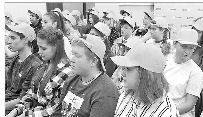
Ребята работали во всех районах города.