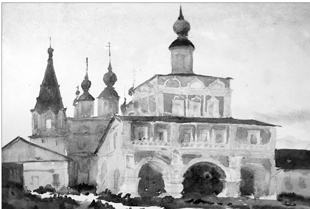
Великий Устюг. Акварель В. Марова.