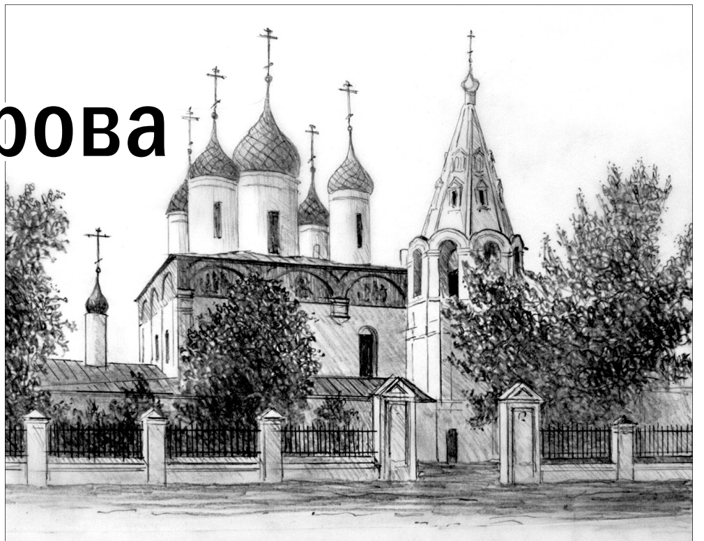
Иллюстрация для книги. Рисунок В. Марова.

Виктор Маров был не только блестящим архитектором, но и педагогом. Преподавал историю русской и региональной архитектуры на кафедре ар-