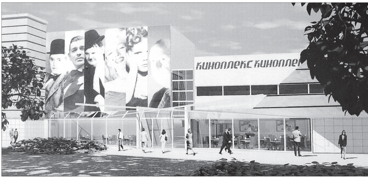
Проект кинотеатра в парке «Юбилейный».