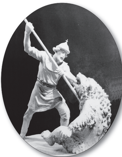
Проект памятника Ярославу Мудрому.

мо всего сделаны проработки и исторического центра Ярославля, показано, как он должен был развиваться. Мы видим парадную Волжскую набережную со сталинскими высотками в духе советского монументального классицизма, олицетворяющего мощь огромной страны. Отрадно, что церкви по этому генплану сохранились, в том числе и Успенский собор, который, увы, в 1937-м взорвали. Правда, Ярославский горисполком, а это были времена воинствующего атеизма, потребовал сделать еще один вариант проекта — со сносом. Если же вернуться к первому варианту, то на высоком берегу Стрелки должны были построить 70-метровый Дом Советов