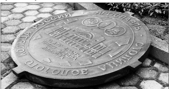
«Туристическая» крышка люка.