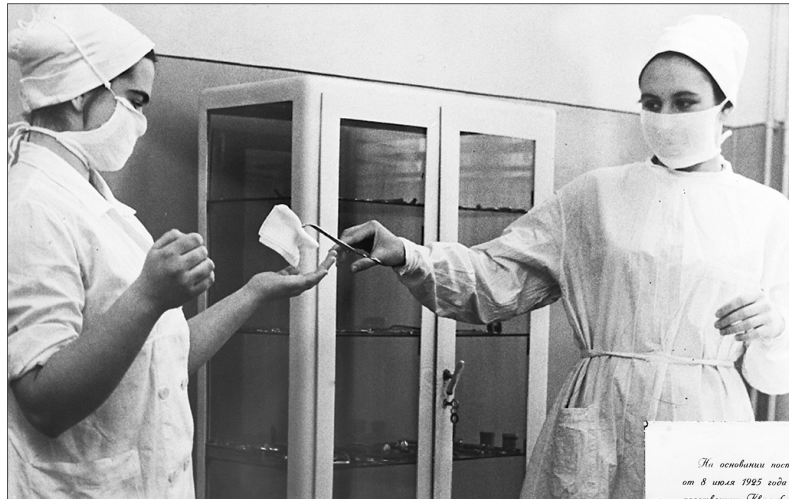
Из альбома о династии Сосниных.

Музей истории города продолжает серию мини-выставок, посвященных ярославскому здравоохранению. Новая экспозиция повествует о славной династии Сосниных.