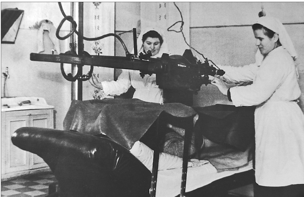
Фото из альбома о династии Сосниных.

БЕСПЛАТНЫЙ дизайн- проект выезд специалиста