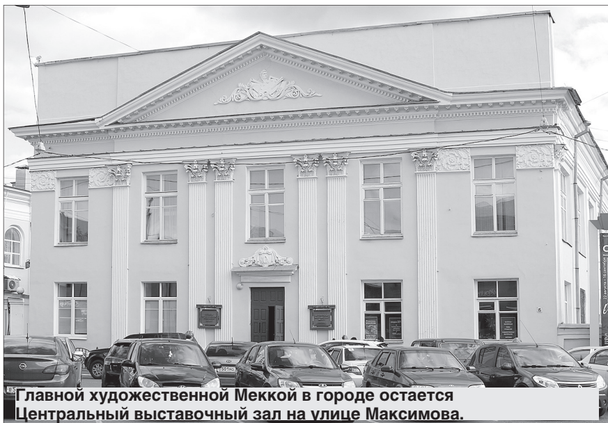
Главной художественной Меккой в городе остается Центральный выставочный зал на улице Максимова.

Ярославское отделение Союза художников России, датой основания которого считается 7 сентября 1933 года, по-прежнему играет значительную роль в творчестве большинства участников выставочного процесса Ярославля.