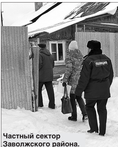
Частный сектор Заволжского района.

— Жители должны соблюдать правила пожарной безо-