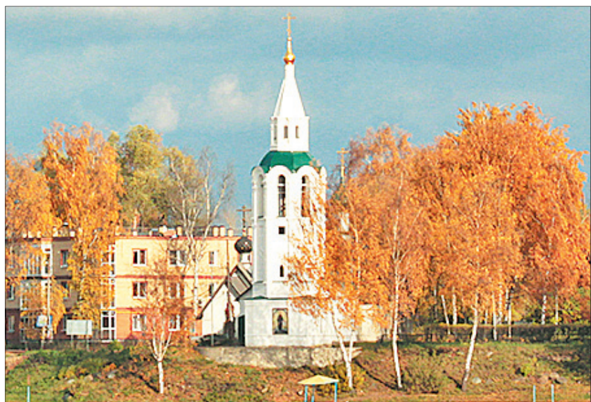
Заволжье. Храм Зосимы и Савватия в Тверицах.