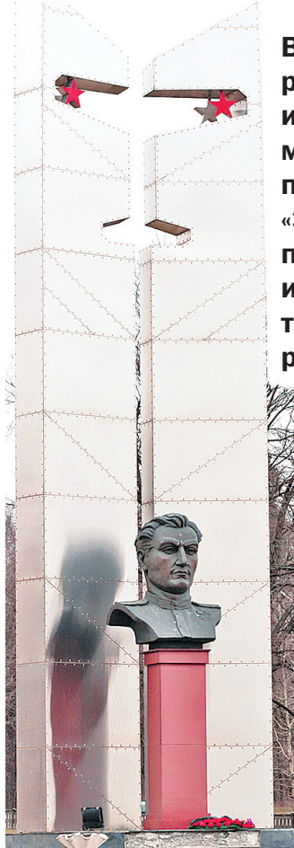
Памятник военному летчику, дважды Герою СССР Амет-Хану Султану.

В 2018 году самому большому и зеленому району Ярославля – Заволжскому – исполняется 80 лет. Торжественное мероприятие, посвященное этой дате, прошло 30 марта во Дворце культуры «Энергетик». Поздравить заволжан пришли представители мэрии и муниципалитета города, главы территориальных администраций других районов, руководители предприятий.