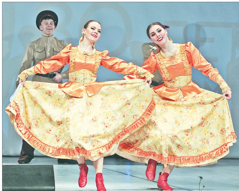
На праздничном концерте.

— Пожалуй, у каждого ярославца в Заволжском районе есть заветные места, которые он посещает, — говорит председатель муниципалитета Ярославля Артур Ефремов. — Для кого-то это Тверицкий бор, для кого-то Яковлевско-Благовещенский храм или Толгский монастырь, детская железная дорога или зоопарк. Заволжский район притягателен для всех горожан. А главная ценность самого района —