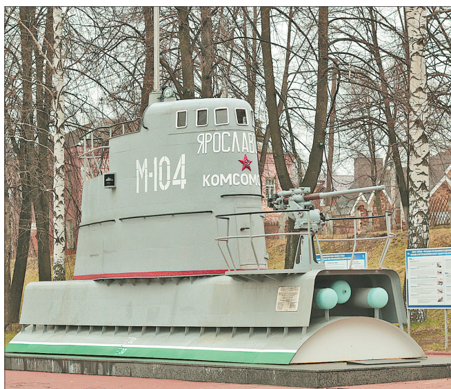
Рубка подводной лодки на аллее Соловецких юнг.

В 2018 году самому большому и зеленому району Ярославля – Заволжскому – исполняется 80 лет. Торжественное мероприятие, посвященное этой дате, прошло 30 марта во Дворце культуры «Энергетик». Поздравить заволжан пришли представители мэрии и муниципалитета города, главы территориальных администраций других районов, руководители предприятий.