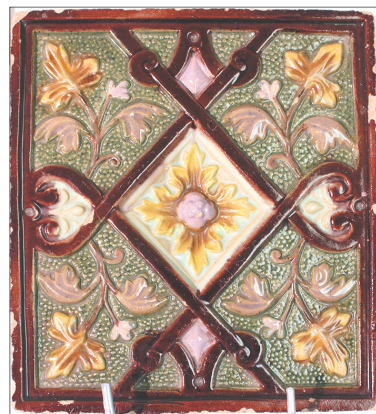
Печные рельефные изразцы.