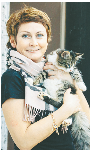
Всем животным нужен дом.