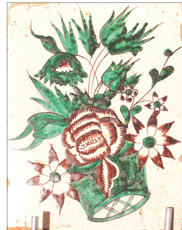
Печной изразец. XVIII – XIX вв.