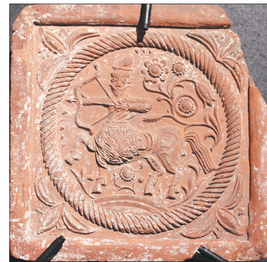
Красный (терракотовый) изразец.