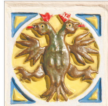
Изразцы в ограде церкви Ильи Пророка.