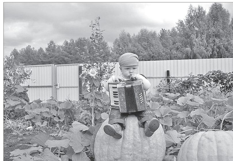
Отдыхать или работать?

▶ Дачный бум девяностых годов совпал в России с волной эмиграции. Некоторые наши соотечественники обосновались в Германии. Немецкое правительство крайне внимательно относится к тому, как эмиграция изменяет специфику общества. В середине девяностых был принят закон, согласно которому семья в пенсионном возрасте имеет приоритетное право на аренду дачного участка, который немцы называют «кляйнгартен», что переводится как «маленький сад». Если в договоре отмечается, то этот самый сад предназначен для выращивания сельхозпродукции, арендная плата существенно снижается. По прошествии 20 лет немецкие социологи провели исследования и обнаружили, что те немцы, которые регулярно арендовали дачу и работали на ней, жили на 10 — 15 лет дольше, чем те, кто предпочитал оставаться в квартире. А значит, что-то важное в дачном образе жизни все-таки есть. При всех минусах, поджидающих дачников на лоне природы.