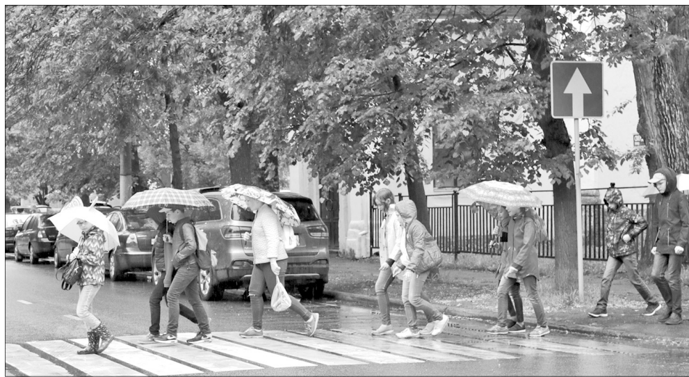
По пешеходному переходу безопаснее.

Каждый день, к большому сожалению, мы слышим об автомобильных авариях на дорогах города и области. Особенно удручает, когда жертвами беспечности взрослых становятся дети. ГИБДД УМВД России по Ярославской области сообщает, что за полгода на дорогах Ярославля пострадали 39 детей до 16 лет и 10 несовершеннолетних от 16 до 18 лет.