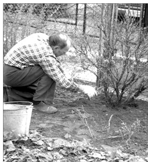
Лучшие предшественники овощных культур

В саду. Завершают обрезку деревьев и кустов, зачистку штамбов, устанавливают наличие вредителей и намечают меры борьбы с вредителями и болезнями сада. Начало апреля. Яблоня. Груша. Вишня. Слива. До набухания почек проводят опрыскивание против клещей и других вредителей и грибковых заболеваний. Конец апреля. Начало распускания почек – (зеленый конус) – и появление листьев – от парши, листогрызущих, вишневой почковой моли и других. Смородина. До набухания почек кусты обрабатывают горячей водой 60 – 70° или опрыскивают, собирают и сжигают вздутые почки (клещи). Конец апреля. Смородина. Крыжовник. Распускание почек – обрабатывают от почкового клеща и мучнистой росы.