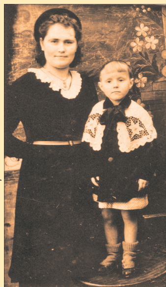
Это фото отцу отправили на фронт. 1944 г.