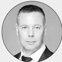
Губернатор Ярославской области Михаил Евраев:

Ярославль готовится к празднованию Дня Победы. В целях обеспечения безопасности формат проведения некоторых мероприятий будет изменен.