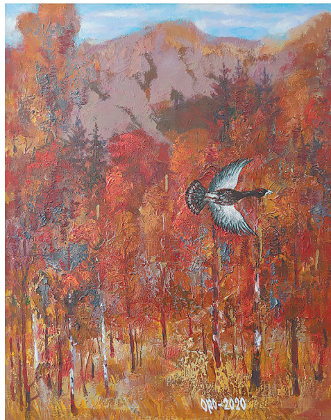
↓ «Осень в горах за Дагомысом».