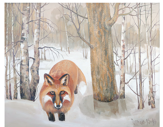
↓ «Время лисьих свадеб».