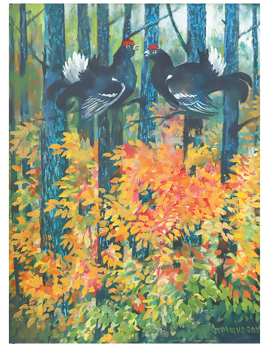
↓ «В Раи пришла уже осень. Тетерева пробуют свои голоса».