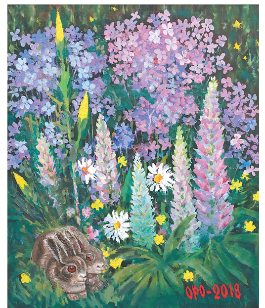
↓ «Флоксы деревенские и люпины».