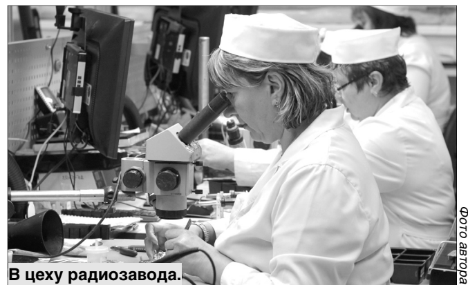
В цеху радиозавода.

сийские и зарубежные военные и силовые ведомства.