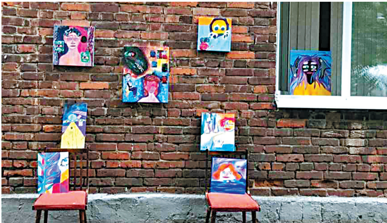
↓ Творчество Марианны вдохновлено работами Поля Сезанна, Эдгара Дега и японскими гравюрами.