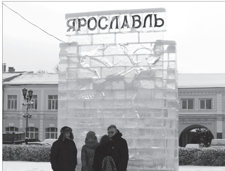
На фоне барельефа с удовольствием фотографируются и горожане, и гости Ярославля.

В предновогодние дни на улице Андропова был установлен барельеф с изображением медведя с секирой