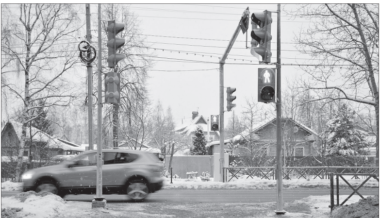
Новый светофор обеспечит безопасность на пешеходном переходе.