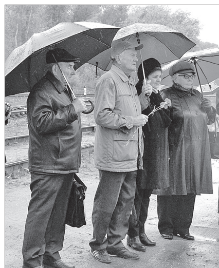
На открытии мемориальной доски.