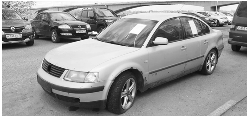
На проезжей части верхнего яруса ул. Волжская Набережная в районе дома № 3 корп. 4 по ул. Республиканской.