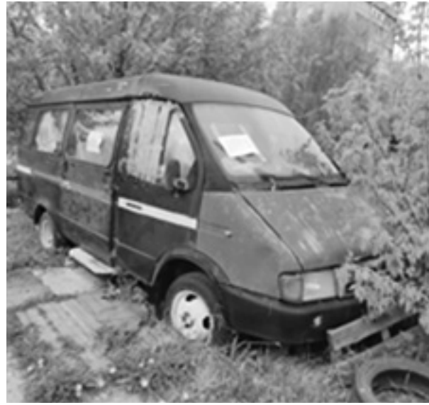
За остановкой Доронина из центра