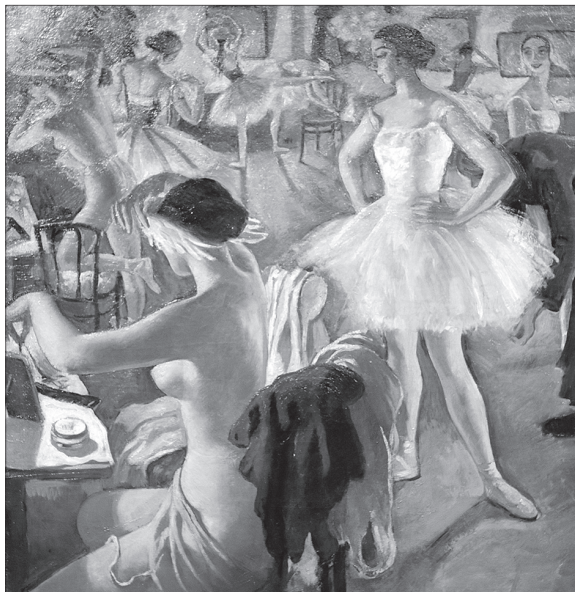
«Балетная уборная». 1924 г.