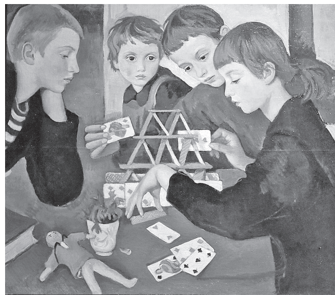
«Карточный домик». 1919 г.

Трагическим для семьи Серебряковой стал 1919 год. От тифа умер муж художницы, имение в Нескучном было разграблено. Зинаида осталась с больной матерью и че-