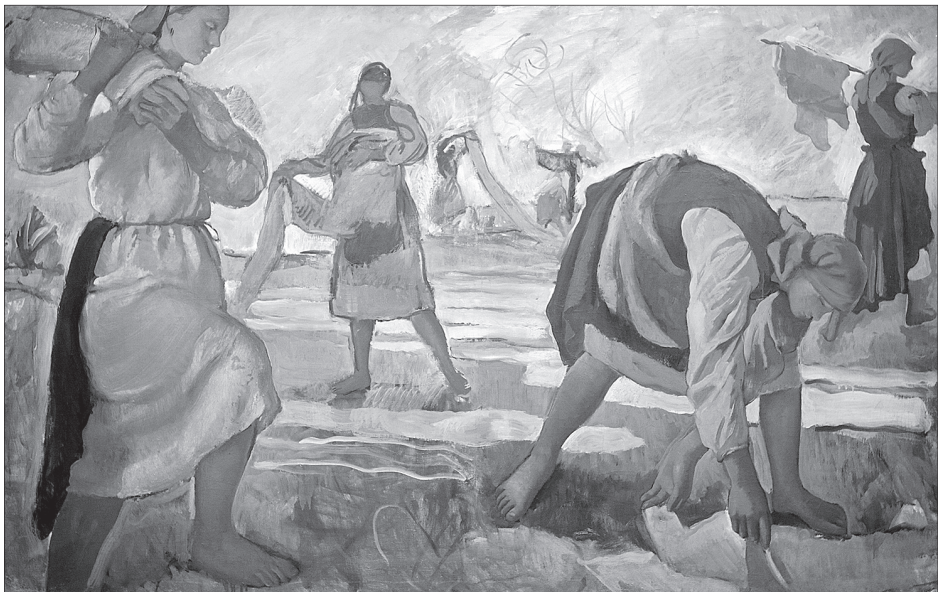
«Беление холста». 1917 г.