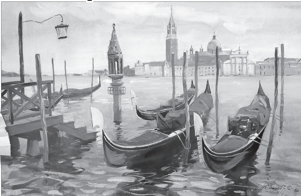
«Венеция. Набережная лагуны».

премии Фонда Анатолия Лисицына «Общественное признание».