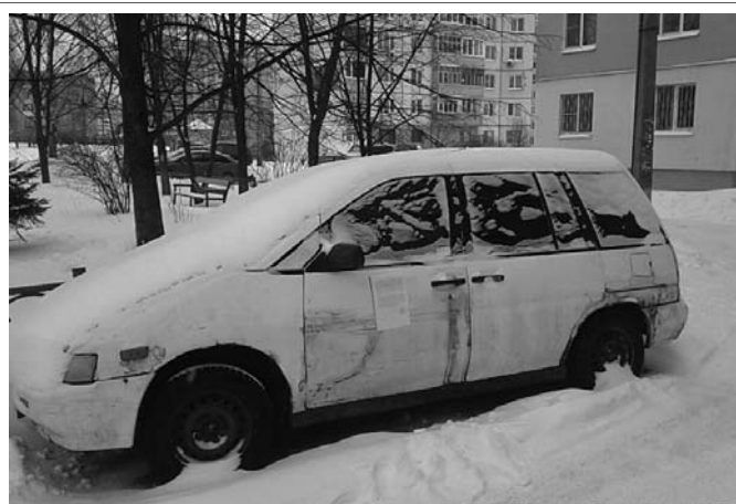
Транспортное средство расположено по адресу: г. Ярославль, ул. Калинина у дома №39, корп. 2

Территориальная администрация Красноперекопского и Фрунзенского районов мэрии города Ярославля