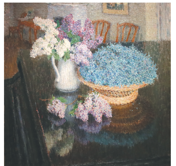
↓ «Сирень и незабудки».

События. Достоинные внимания Городские новости