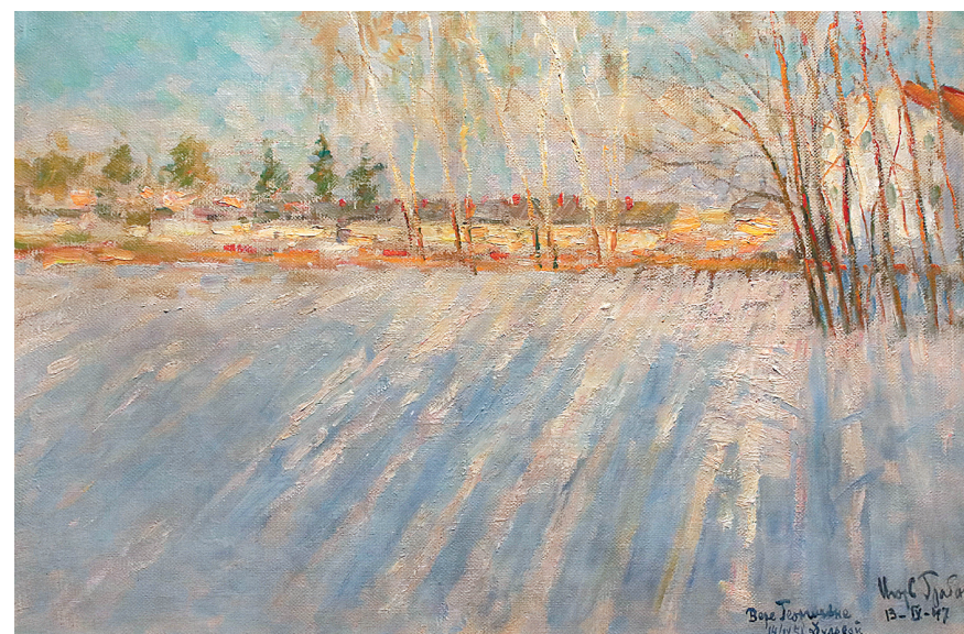
↓ «Вечерние тени».