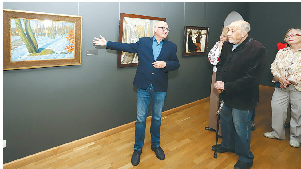
↓ На выставке.

– Многих художников в начале XX столетия интересовал мир дворянской усадьбы, к тому времени уже угасающий, под воздействием этого оказался и Грабарь, – поясняет кура-