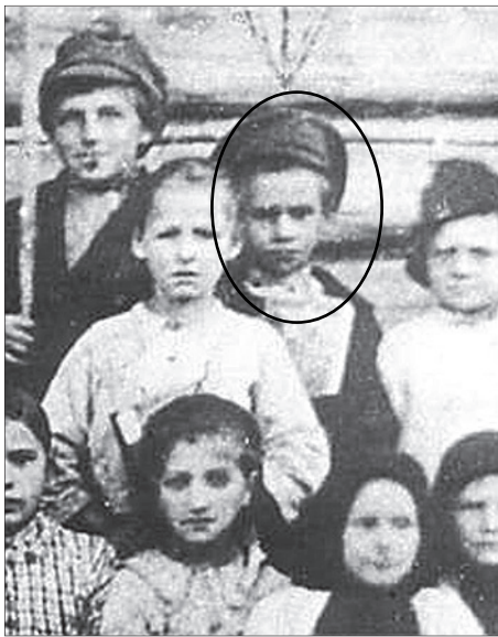
Единственная прижизненная фотография Павлика Морозова.

Что же побудило Павлика Морозова выступить на суде против отца? Его отец Трофим Морозов, сын тюремного надзирателя, числился в бедняках, и по рекомендации властей его избрали председателем сельсовета. В окрестностях их деревни Герасимовки жило много спецпереселенцев — раскулаченных казаков, выселенных с Кубани. Жилось им трудно, но чтобы уехать домой, нужна была справка, что они выполнили все поставки и являются бедняками. Одного из таких переселенцев милиция задержала с подложной справкой, выданной Трофимом Морозовым. В ходе разбирательств выяснилось, что таких справок Трофим выдал немало — «бедняцкие» справки он предоставлял заведомым кулакам, помогая им избежать налогов. Справки выдавал за день-