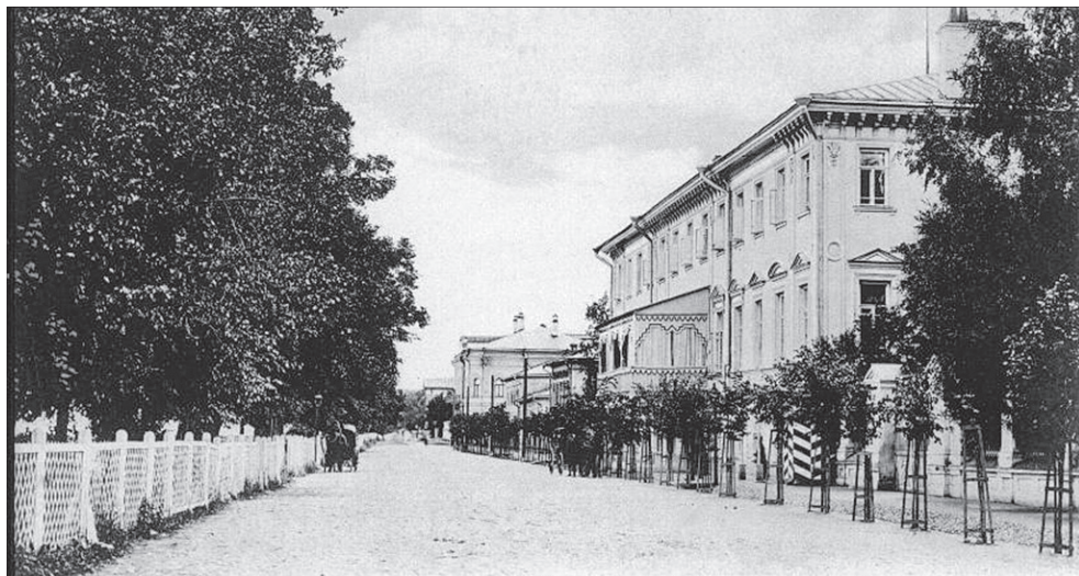
В Губернаторском доме в прошлом веке губернаторы и жили, и работали.