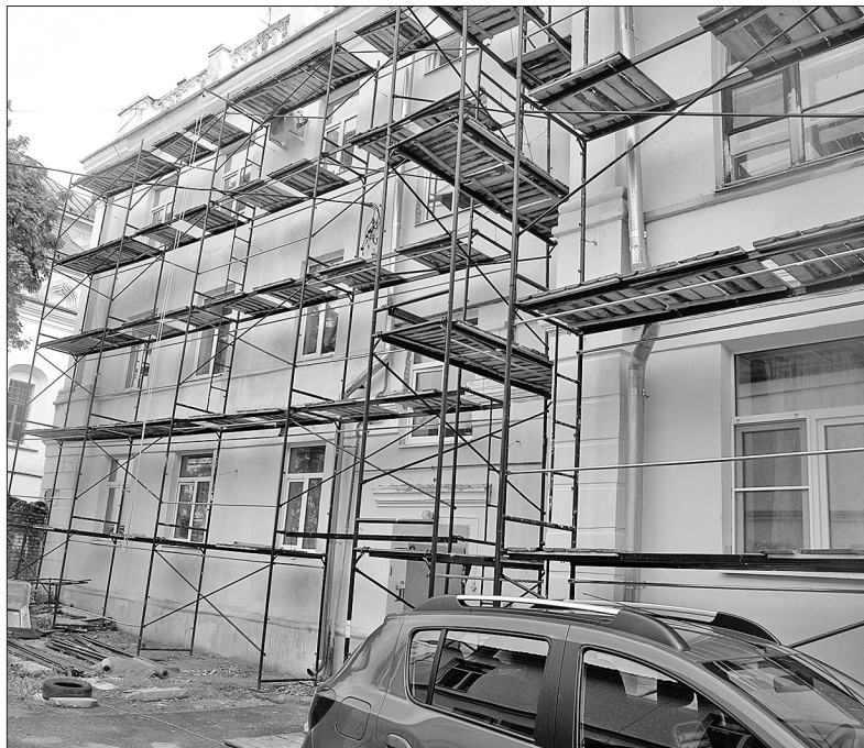
Работы по ремонту фасада идут на пересечении улицы Революционной и площади Челюскинцев.