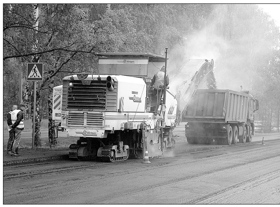
Дорожное покрытие на улице Маяковского снято, скоро здесь начнется укладка нового асфальта.