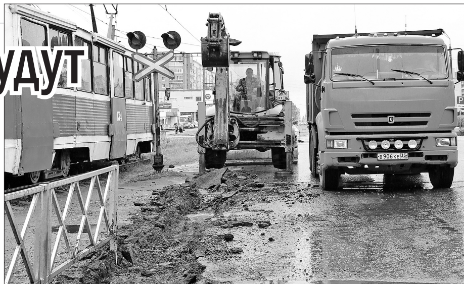
Ремонт дороги на перекрестке Панина и Труфанова.