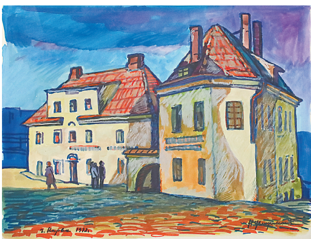
«Нарва». 1972 г.