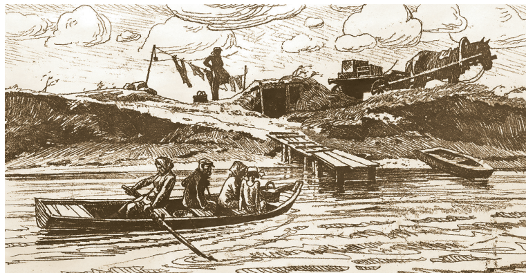
«Ивановский перевоз». 1980 г.