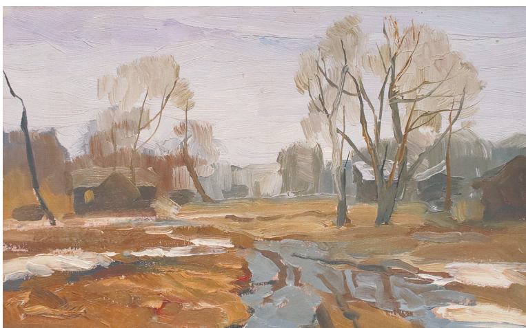
«Слякотный апрель». 1988 г.