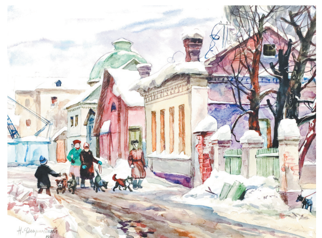
«Собачники». 1986 г.