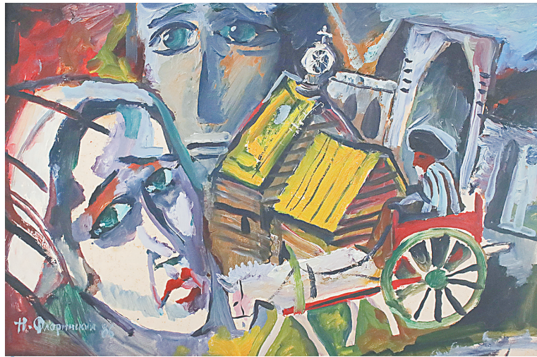
«Арба». Из серии «Путь с Востока». 1986 г.