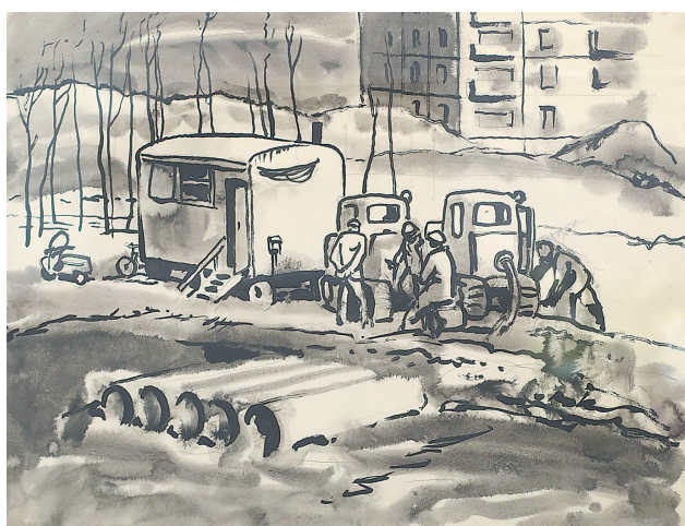
«Строится новый район». 1971 г.