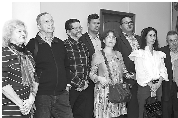
На открытии выставки.

25 октября в здании мэрии Ярославля открылась выставка «Добро пожаловать в Ханау»