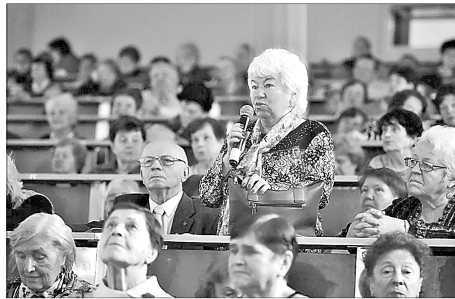
Ветераны смогли задать волнующие их вопросы мэру Ярославля.