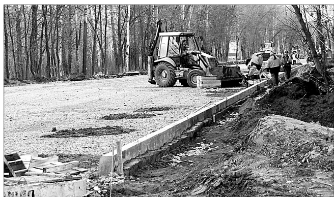
Ведется установка бордюрного камня.