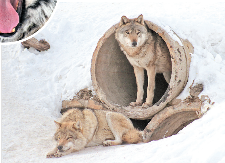
Волкам и в неволе неплохо.

Его нашли в декабре 2011 года на одном из московских пустырей совсем маленьким. Скорее всего, он был выброшен