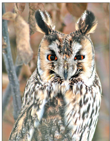
Сова — ночная птица.

— Ярославский зоопарк — один из крупнейших не только в России, но и в Европе, — подчеркнул заместитель председателя правительства Ярославской области Роман Колесов. — Область заинтересована в расширении зоопарка и его развитии и готова выделить для этого земельные участки.