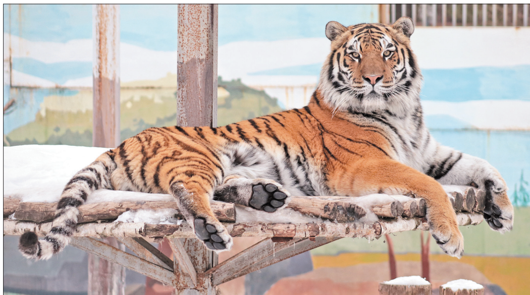
Тигр Тамерлан и правда красавец.