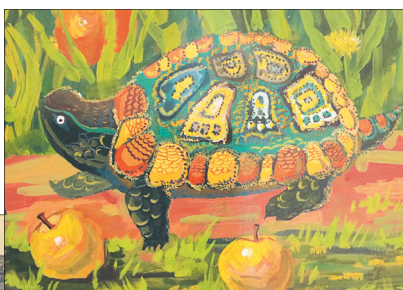
«Черепашка с яблоками».