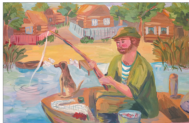
«Утро на Волге».