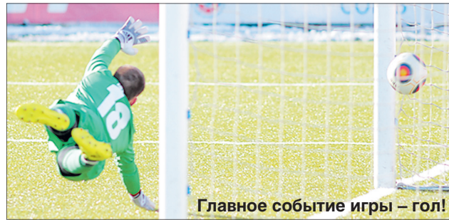
Главное событие игры – гол!

Оставшиеся домашние игры «Шинника» в текущем сезоне: